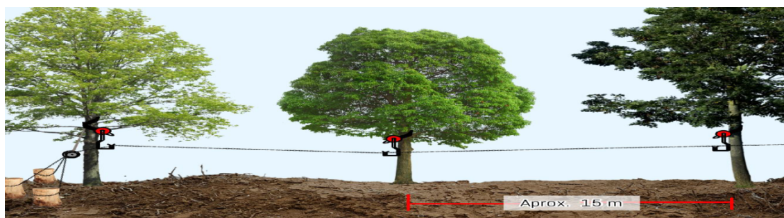
Ilustración 3. Vista lateral del recorrido de un tramo de cable principal propuesto para el transporte menor de madera en los NDF detallando las alzas y los extremos de sujeción

(NOTA Aclaratoria: el distanciamiento entre alzas es de 10 mts)