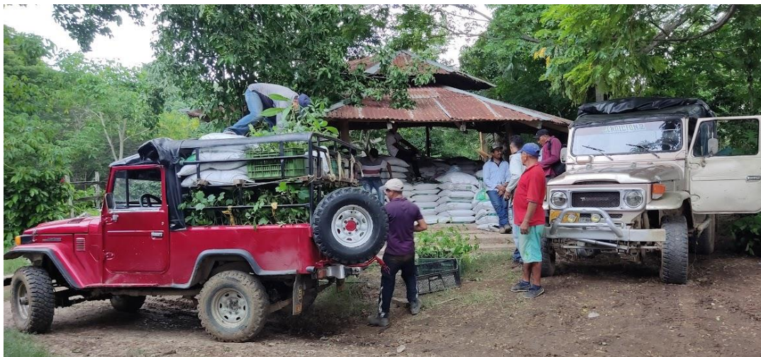
Imagen 5. Proceso de cargue de material vegetal e insumos de plantación

Como estrategia de acopio, se adecuaron dos predios, uno ubicado en el municipio de El Carmen de Bolívar en la vereda Villa Edith, y un predio colindante al casco urbano en el municipio de Chalán. En estos predios se realizó junto con la comunidad y equipo de promotores el acopio, organización por especies, riego y control sanitario, y despacho del material vegetal a cada uno de los predios vinculados al proyecto.