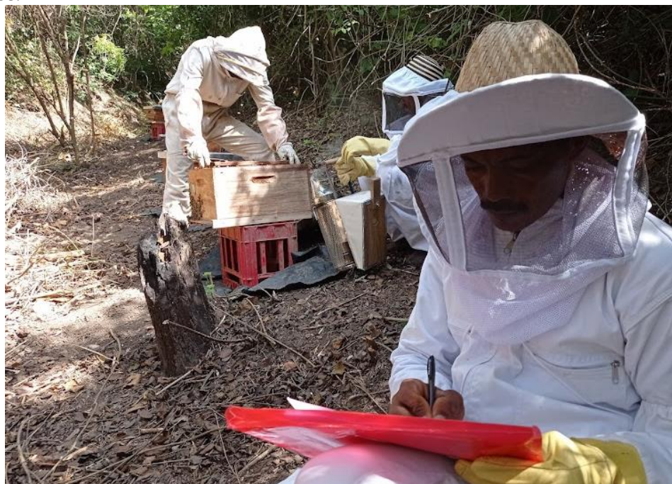
Ilustración 1 Promotore realizando registro de estado de la colmena en la vereda Pativaca

El proyecto contó con 12 promotores y un experto apícola que durante el 2021 y 2022 realizaron visitas técnicas a los apiarios colectivos. A partir de octubre del 2022 y hasta 15 de febrero del 2023, al equipo se sumó dos expertos locales apícolas que apoyaron el acompañamiento técnico a los participantes a través de la realización de visitas a los apiarios colectivos.