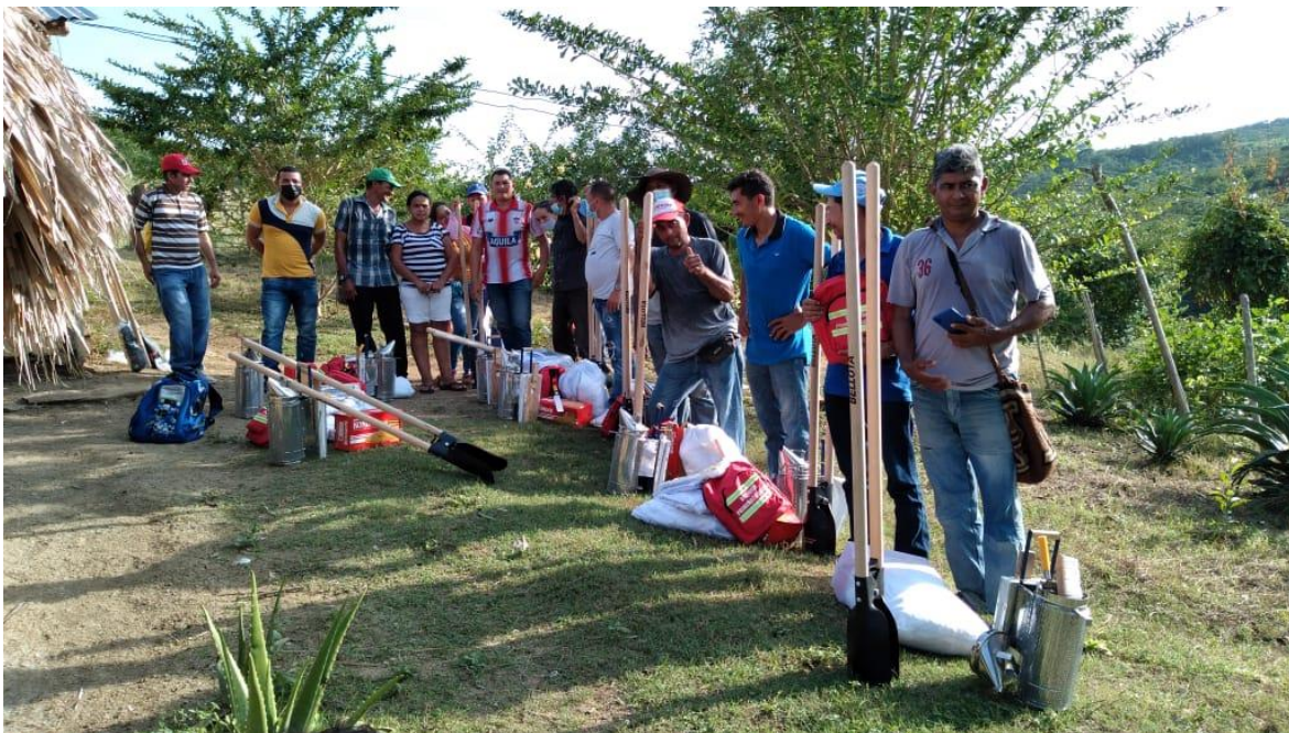
Imagen 8. Entrega de EPP y herramientas apícolas.

Las herramientas proporcionadas por el proyecto Saber del Monte son esenciales para que los 188 participantes implementen buenas prácticas apícolas en los 68 apiarios colectivos del proyecto, promoviendo la ejecución de un trabajo seguro y garantizando la calidad de la producción de miel. El proyecto invirtió un total de $ 90.304.000 en herramientas apícolas, con un valor por participante de $ 480.340,43. A continuación se presenta el número y valor total de las herramientas adquiridas: