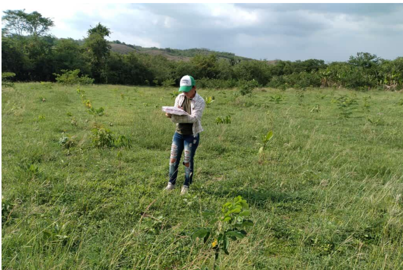
Imagen 6 Promotora apícola realizando monitoreo de sobrevivencia de plantaciones.

A nivel municipal en el Carmen de Bolívar se plantó un total de 65.836 árboles y en Chalán 16.536. En la siguiente tabla se indica el número de árboles plantados por organización vinculada al proyecto para cada una de las tres etapas de plantación.