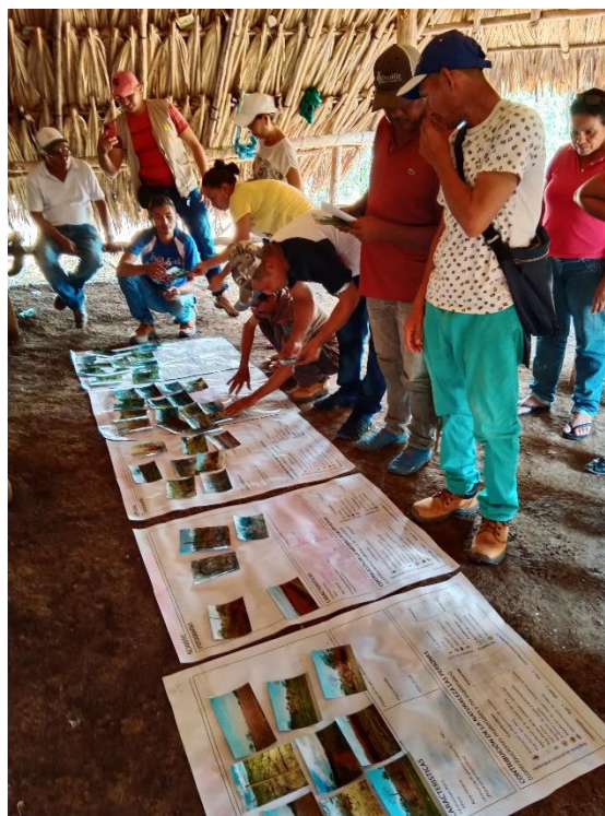
Imagen 1. #10 Valoración cultural del Monte - Sesión 1 – vereda Santa Rita

Se llevó a cabo 14 encuentros en cada uno de los 9 núcleos veredales con el propósito de brindar espacios de capacitación, transferencia y construcción de conocimientos en diferentes temáticas relacionadas con el bosque seco tropical, su cuidado y rehabilitación ecológica (Componente 1), la apicultura y su ciclo productivo (Componente 2) y la interacción entre componentes en diferentes temáticas y escalas territoriales. Se realizó 4 talleres correspondientes al Componente 1, 6 talleres al Componente 2 y 4 talleres transversales a los componentes y al PGAS. En general, el porcentaje de participación fue de 79,26%. A continuación, se presenta una tabla con la fecha, nombre del taller, temática, componente, número de asistentes y porcentaje de asistencia.