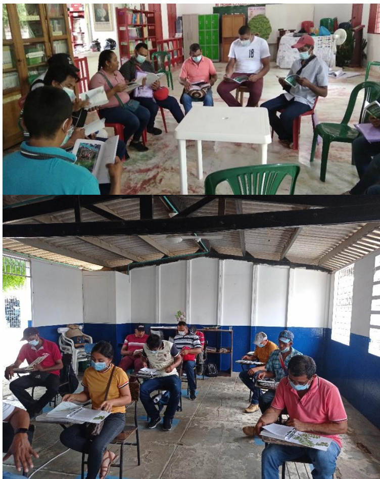
Imagen 2. Talleres de formación a promotores apícolas.

Para ampliar la información por taller de formación de promotores se cuenta con el siguiente Capacitaciones promotores , donde reposa los soportes para cada uno de los eventos.