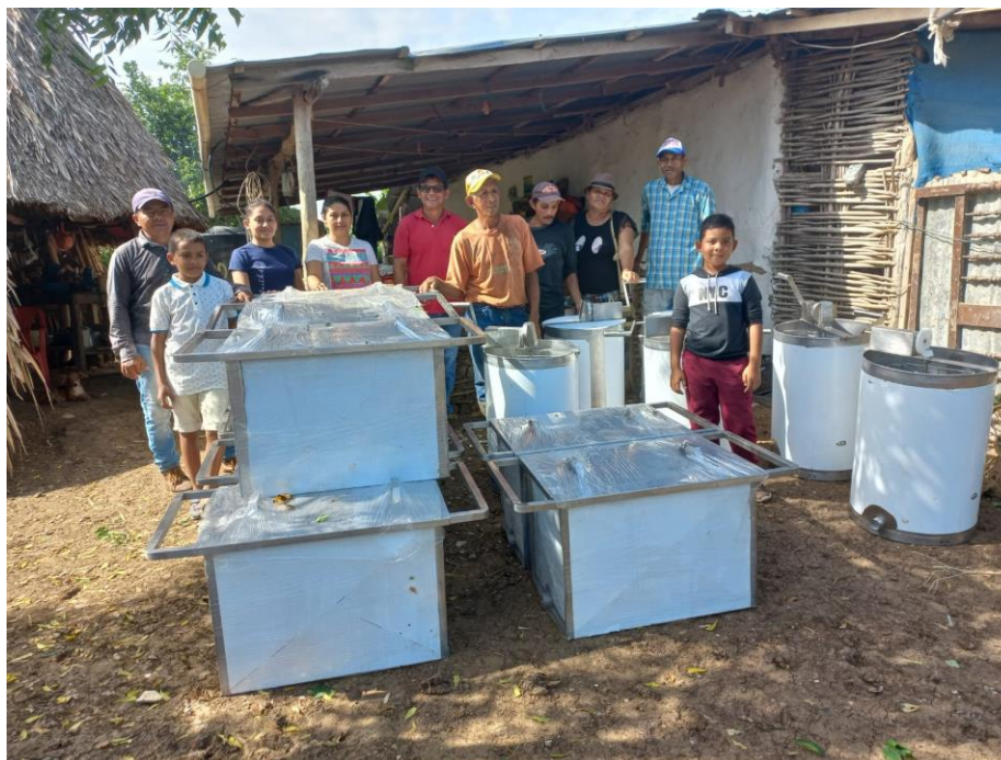
Imagen 10 Entrega de equipos de cosecha en la vereda Roma

Se adquirieron 40 centrifugas tangenciales con características específicas para el manejo de alimentos, construidas en acero inoxidable AISI 304 calibre 20 grado. Estas centrifugas cuentan con un sistema motriz por engranes cónicos hechos en material sintético y una canasta interna fabricada en eje de 3/16 y eje de 1/4 en acero inoxidable AISI 304, así como una salida de miel con llave de paso tipo guillotina. Su diámetro es de 50 centímetros y tienen una relación de engranes de 3 a 1.