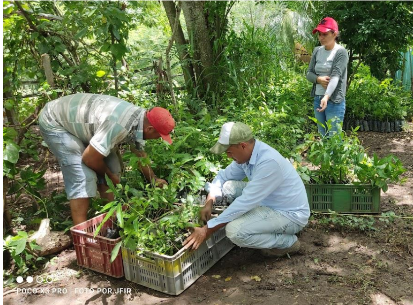
Imagen 4 Acopio de material vegetal en el predio Villa María, vereda Villa Edith – El Carmen de Bolívar.

Como estrategia de acopio, se adecuaron dos predios, uno ubicado en el municipio de El Carmen de Bolívar en la vereda Villa Edith, y un predio colindante al casco urbano en el municipio de Chalán. En estos predios se realizó junto con la comunidad y equipo de promotores el acopio, organización por especies, riego y control sanitario, y despacho del material vegetal a cada uno de los predios vinculados al proyecto.