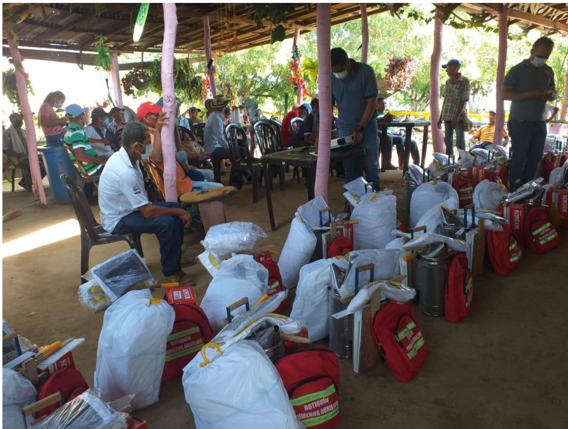
Imagen 9 Entrega de EPP y herramientas apícolas.

Relacionado a los EPP apícolas se invirtieron recursos por el orden de $ 65.337.532, con una inversión por participante de $ 347.540,06. Los EPP apícolas garantizan el ejercicio seguro de actividades apícolas, procurando por el bienestar de los apicultores y sus familias. En la siguiente tabla se presenta el detalle de los elementos adquiridos y su valor.