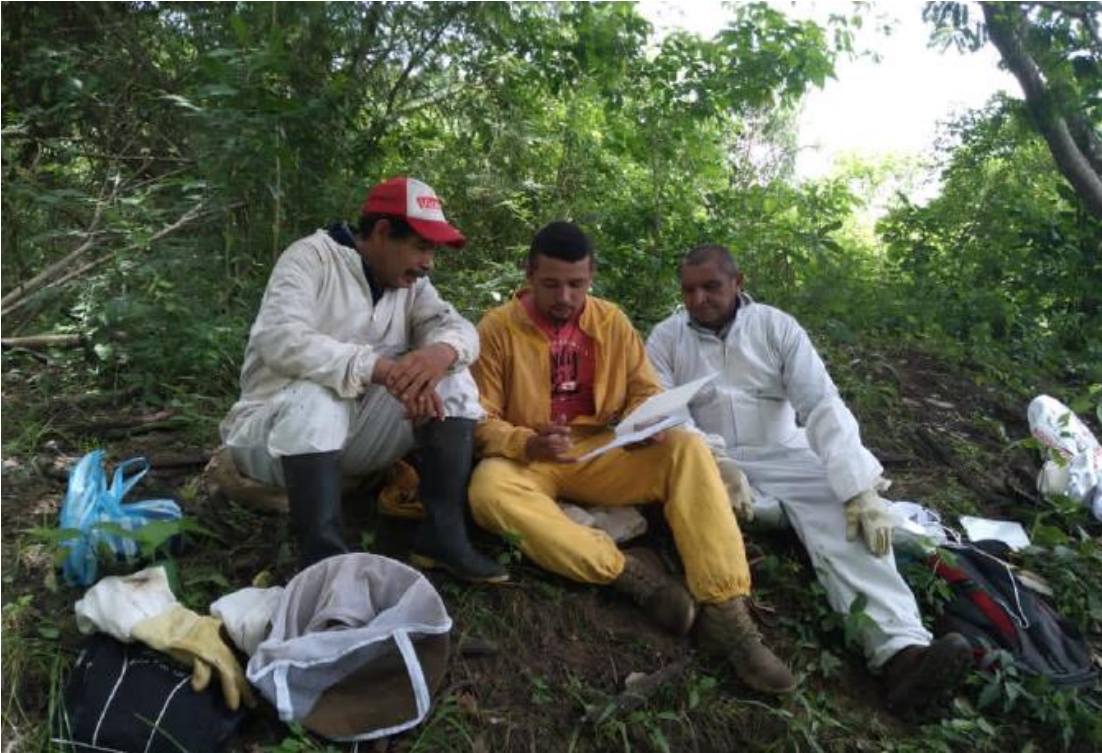
Imagen 3 Visita técnica realizada por promotor apícola en la vereda Pativaca

Durante 20 de los 26 meses de ejecución del proyecto, los promotores apícolas desempeñaron labores de acompañamiento técnico y recolección de información. Cada mes, se realizaba una visita técnica en la que los promotores socializaban, recolectaban y construían información intermedia o final junto a los participantes del proyecto.