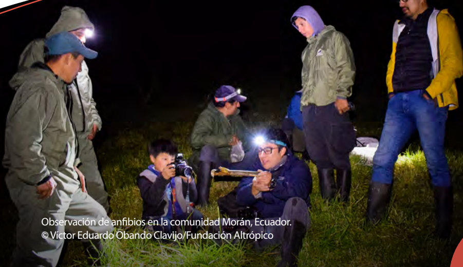
Observación de anfibios en la comunidad Morán, Ecuador.