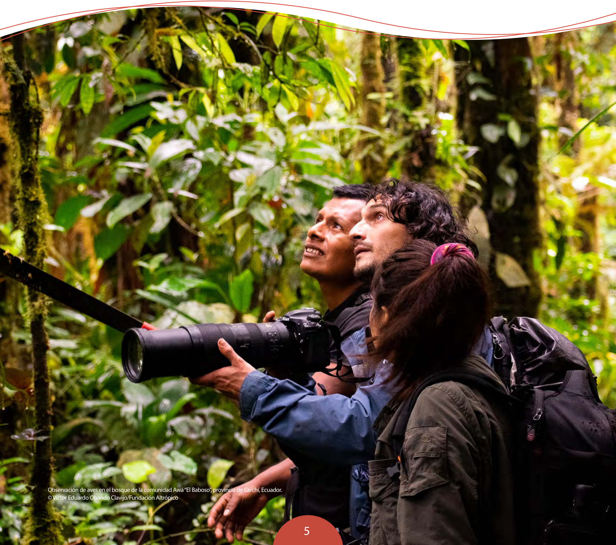
Observación de aves en el bosque de la comunidad Awá "El Baboso", provincia de Carchi, Ecuador.

El rol del RIT en el Hotspot Andes Tropicales ha sido clave en la gestión de las subvenciones, en el asesoramiento técnico, en el desarrollo de procesos clave en la generación de capacidades, en el monitoreo de los impactos de conservación generados por los proyectos, y en la promoción y difusión de los resultados.