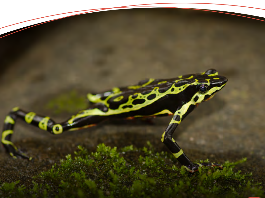
Atelopus wampukrum sp., en la Reserva Natural Maycú