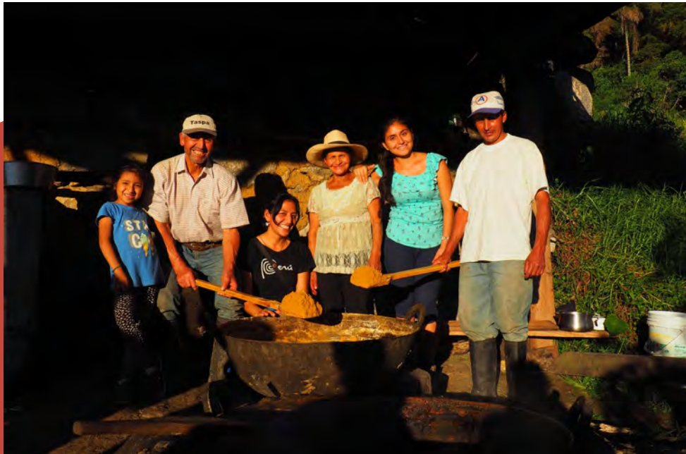
Intercambio de conocimientos sobre panela.

CEPF promovió la conservación de paisajes productivos a través de incentivos y pequeñas empresas relacionadas al ecoturismo, café sostenible, pagos por servicios ecosistémicos y acuerdos, que en conjunto proporcionaron grandes incentivos económicos para la conservación.