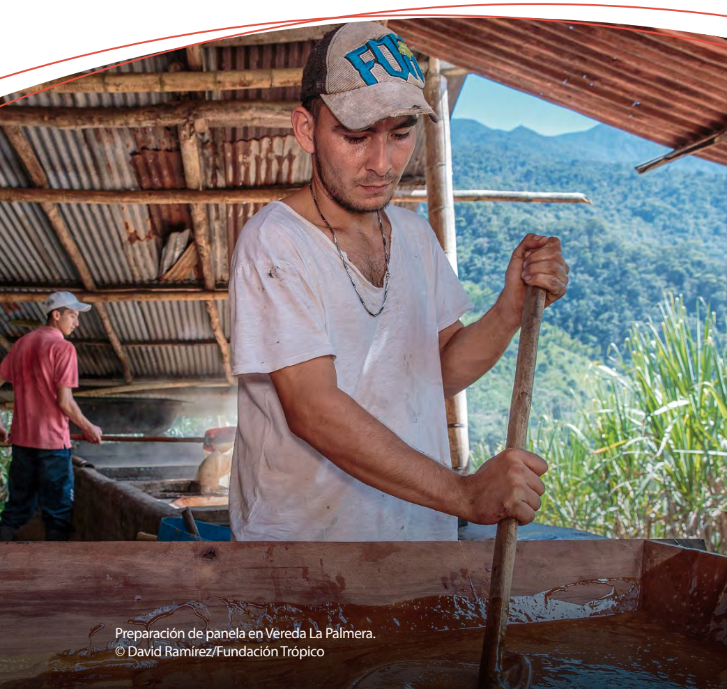
Preparación de panela en Vereda La Palmera.