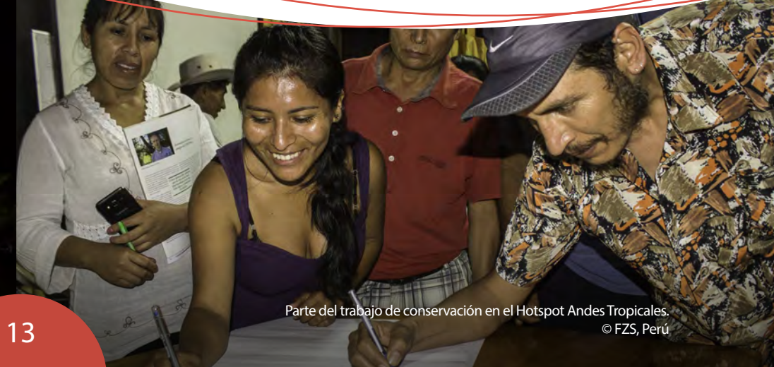
Parte del trabajo de conservación en el Hotspot Andes Tropicales.