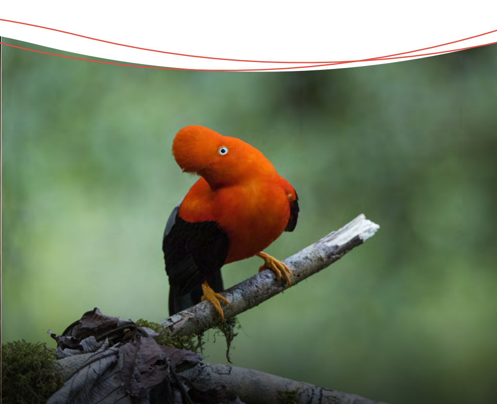
Gallito de las rocas, rupicola peruvianus .