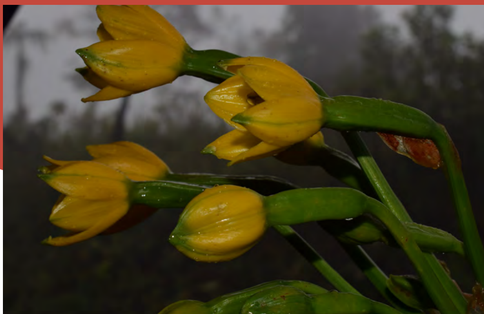
Pamianthe ecollis , en Vereda Nuevo Horizonte-Argelia-Colombia.

La mejora en la gestión en KBA se logró a través de una gama completa de acciones, como la aprobación de planes de gestión de nuevas áreas protegidas, actualización de los mismos con participación comunitaria en la gestión; y proyectos agroforestales que evitaron la invasión de áreas de conservación y que ayudaron a la restauración de áreas degradadas.