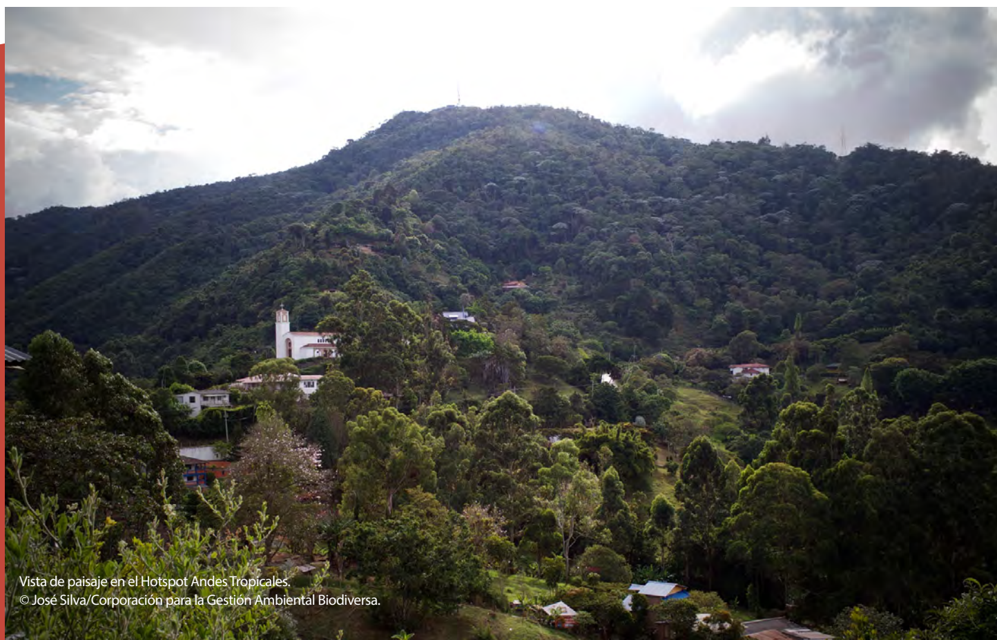
Vista de paisaje en el Hotspot Andes Tropicales.

Estas alianzas ayudaron a los beneficiarios a aprovechar las diferentes experiencias y capacidades disponibles dentro de la “familia” del CEPF en los Andes Tropicales, generando así procesos más eficientes y optimizando los impactos de las diversas subvenciones.