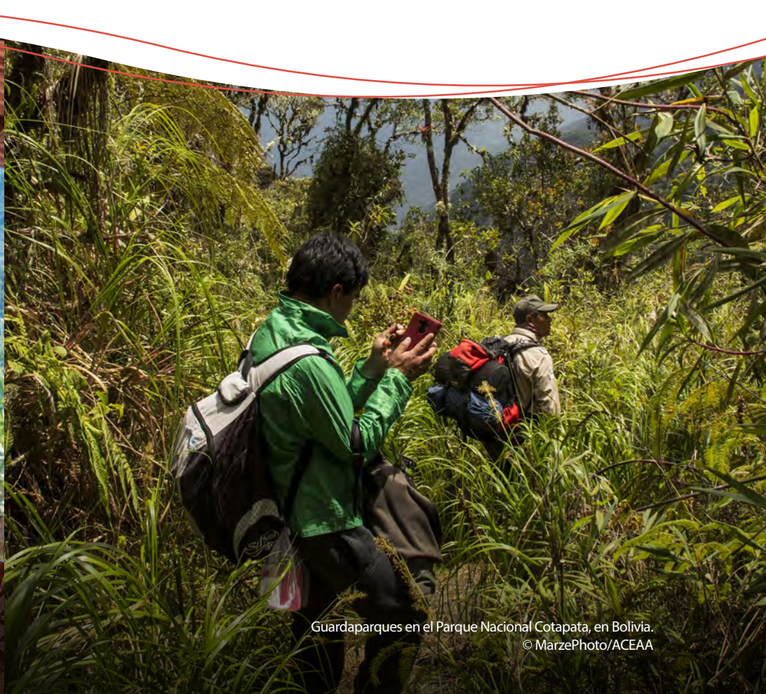
Guardaparques en el Parque Nacional Cotapata, en Bolivia.